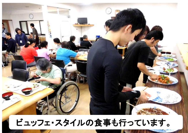
ビュッフェスタイルの食事も行っています。

食事、洗濯、清掃はもちろん、時には対人関係や将来への不安等の相談に乗ったり、具合が悪い場合はかかりつけ医への受診をサポートしたりと、生活全般を支援させていただきます。