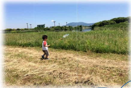
虫を追いかけ、駆け回り

子どもたちが、お家で過ごすことや保育所や幼稚園で集団生活を送る上で困ったり、難しかったり、頑張りすぎることをおうちの方や先生方と一緒に考えて、支援し応援します。