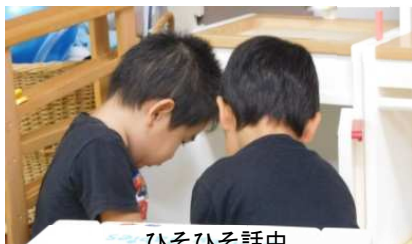
ひそひそ話中 「しーっ」邪魔しないで！