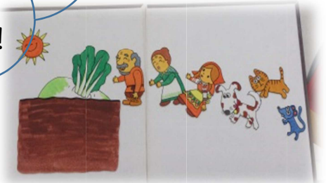
パネルシアターで読み聞かせ