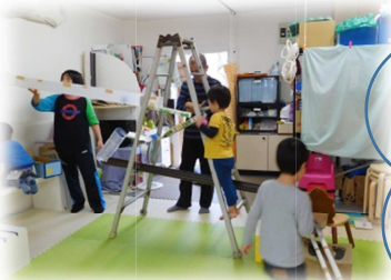
即席ピ・タ・ゴ・ラ！出現