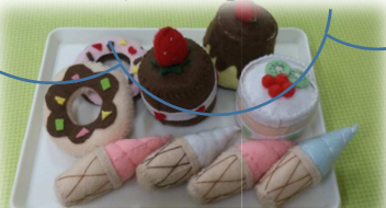
お店屋さんごっこ